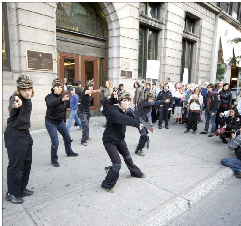
Prestation artistique lors d'une manifestation devant le centre de recrutement de Montréal