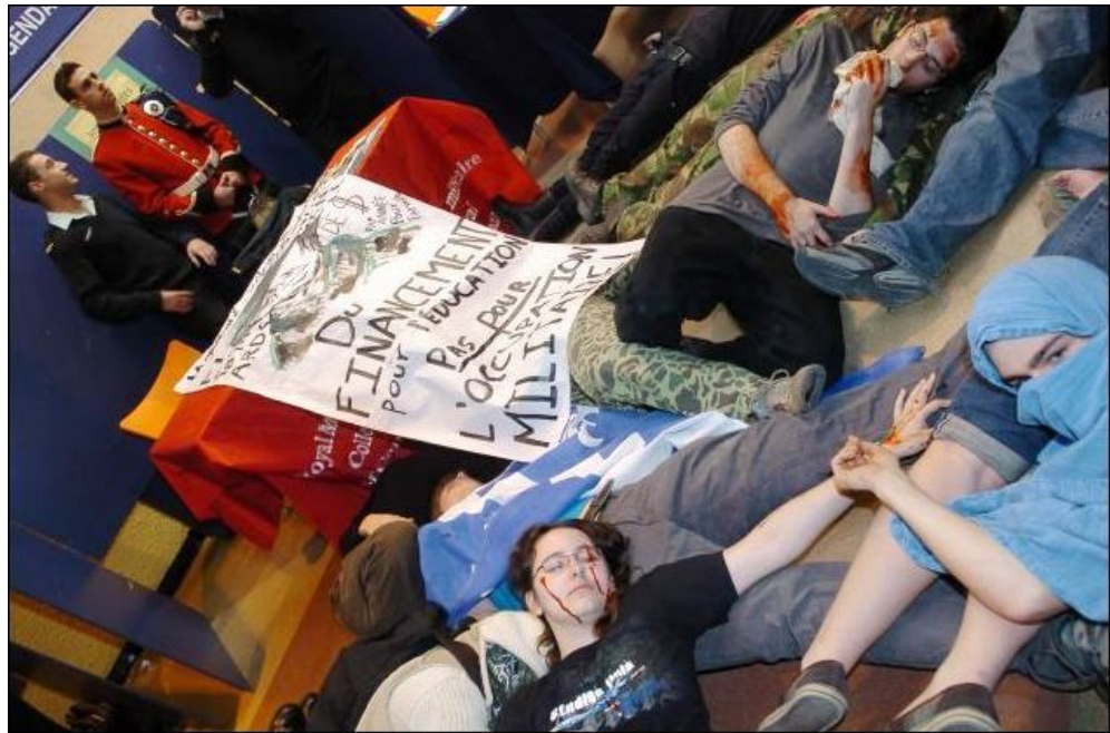
Manifestation théâtrale contre la visite du collège militaire au cégep de Ste-Foy

Suite à cette adoption, les associations étudiantes présentent leur prise de position à l'administration de leur établissement et lui demandent de respecter la volonté exprimée par leurs membres en interdisant la présence des recruteurs et leur publicité. Bien que cette approche soit suffisante sur certains